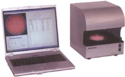
436-000 Scan 500 型自动影像菌落计数仪

自动影像分析菌落计数仪广泛应用于食品和饮料的品质和卫生检验、水质分析、乳及乳制品的检测、医院临床检验、化妆品检验和药品的品质和质量检测等等，适用于对微生物的菌落计数和计算、抗生素的抗菌性测试和菌种筛选等，是现代微生物检测实验室先进和高效的菌落计数器。